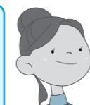
Bさん (30代 女性)

これまでは昼食後、事務所で新聞を読んだりパソコンを見たりして過ごしていました。今ではチームのメンバーと連れ立って、近くの公園内を楽しくウォーキングしています。少し減量もできました!