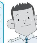
Cさん (40代 男性)

活動に参加するようになってからは、エレベーターやエスカレーターを使わず、できるだけ階段を上り下りするよう心がけています。チーム内で競い合うことで、コミュニケーションも図られるようになったと思います。